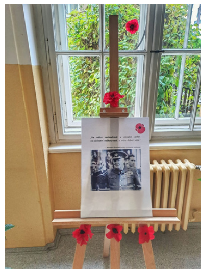
Den válečných veteránů 11. listopadu 2022

Ve sbírce na pomoc válečným veteránům, kterou organizuje Paměť národa, se v naší škole vybrala částka 3 703 korun! Všem, kteří přispěli, mnohokrát děkujeme!