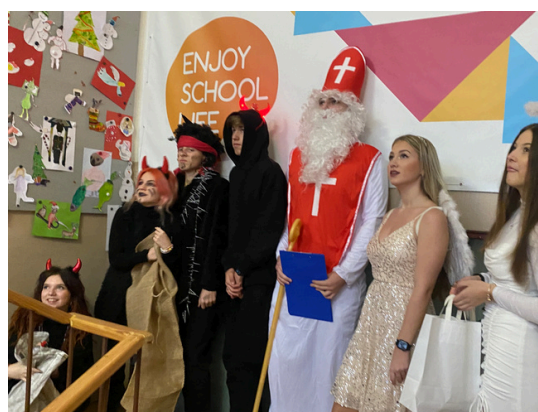
Mikuláš na Stodůlkách

Například třídy 5. E a 6. A letos navštívily Bavorsko. Prvním cílem našeho výletu byl Rothenburg ob der Tauber. Po krátkém výletu do centra města následoval rozchod, který žáci využili k tomu, aby navštívili vánoční trhy v tomto sice malém, ale malebném městečku, a také si místo prohlédli. Druhý den jsme se vydali do většího Norimberku. Vánoční výlety jsou jak pro žáky, tak pro učitele vždy příjemný způsob, jak nasát správnou vánoční atmosféru, a my doufáme, že tato tradice přetrvá i v dalších letech.