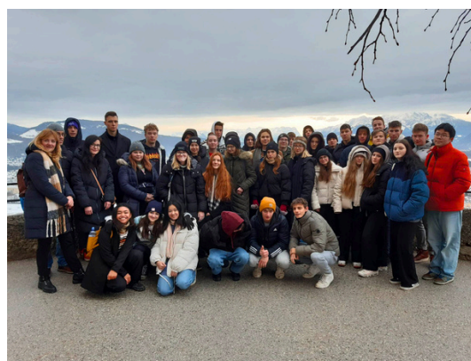
6.E, 8.A a 2.D v Salzburgu