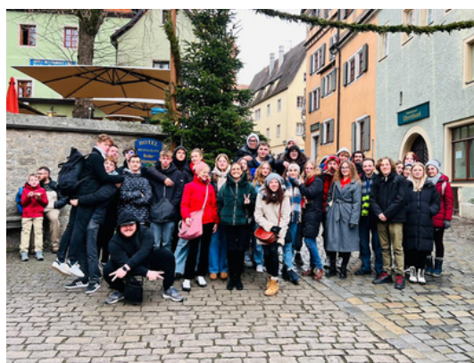
5.E a 6.A v Rothenburgu ob der Tauber