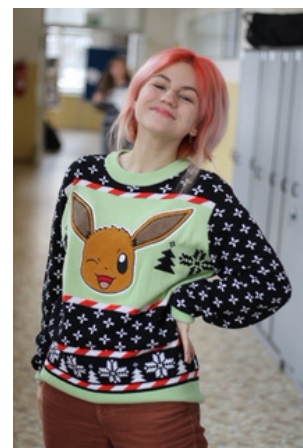
Vánoční svetráda 14. prosince 2022